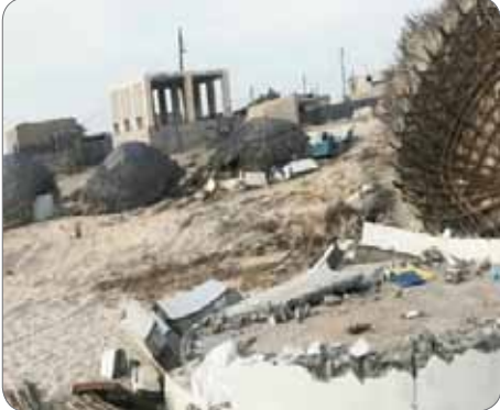
هنگام تخریب شد

بندرعباس– ایرنا– ساخت و سازهای غیرقانونی به دلیل رعایت نکردن حریم