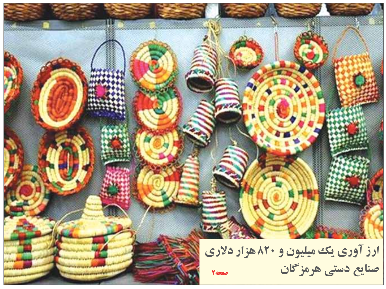
ارز آوری یک میلیون و ۸۲۰ هزار دلاری صنایع دستی هرمزگان